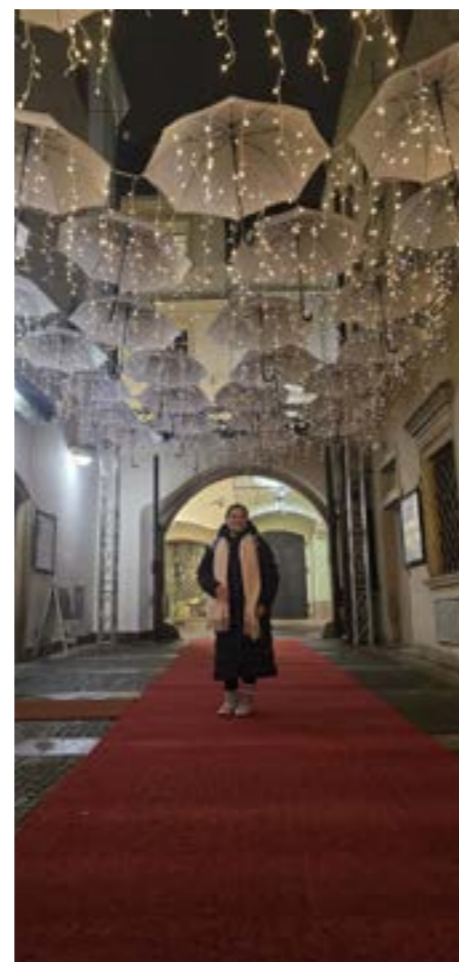
Kuvat 13, 14