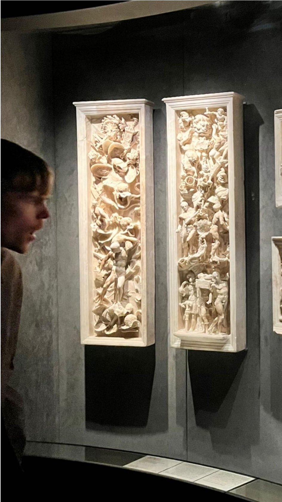
Museovierailun jälkeen pääsimme vihdoin kiertämään kaupunkia.