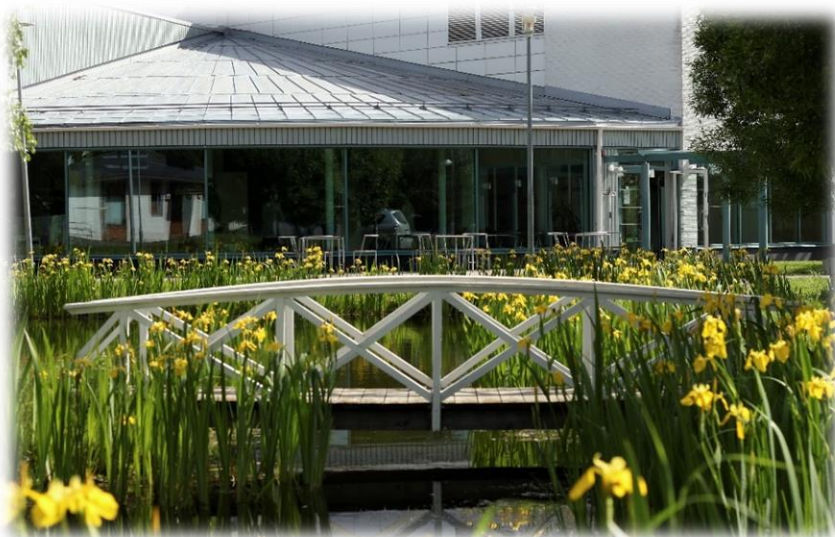
Vanhan päärakennuksen kuva on kannessa, vasemmalla on kuva Liakka-talosta.

Hääjuhlaa varten kampuksellamme on käytettävissä kaksi erillistä tilaa. Useimmiten varsinainen hääjuhla pidetään yli 120-vuotiaan vanhan päärakennuksen juhlasalissa ja ruokailut järjestetään vuonna 2012 valmistuneessa Liakka-talon ravintola Katajanmarjassa. Moderni ravintola sopii myös sellaisenaan pienempien juhlien – tai vaikka koko hääjuhlan järjestämiseen. Rakennukset sijaitsevat vierekkäin opiston pihapiirissä, jossa on lisäksi tarjolla runsaasti majoitustilaa häävieraille. Vanhan päärakennuksen juhlasaliin ja ravintola Katajanmarjaan mahtuu kerralla juhlimaan noin 130 henkilöä.