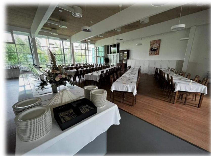
Alla kuva Liakka-talon ravintola Katajanmarjasta.