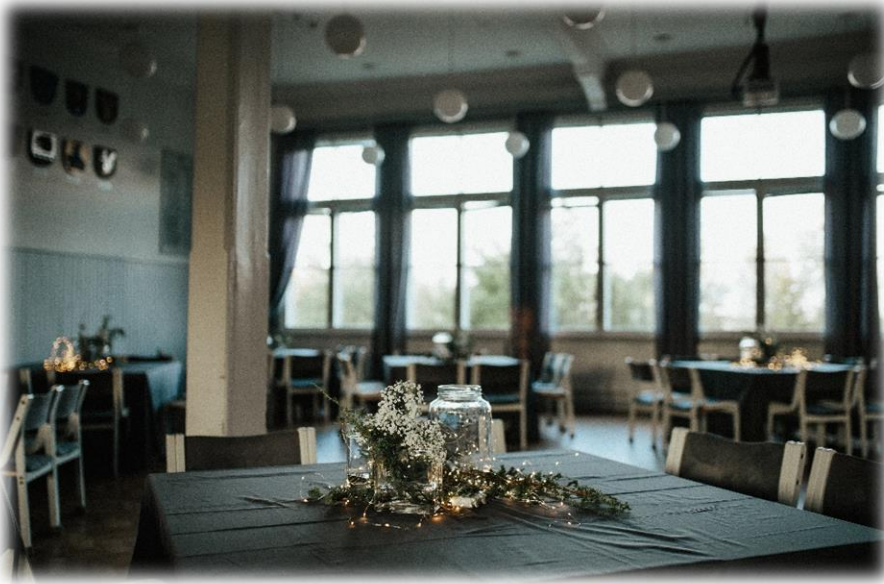
Ohessa kuvia vanhan päärakennuksen juhlasalista häätjuhlatuokiosissa.