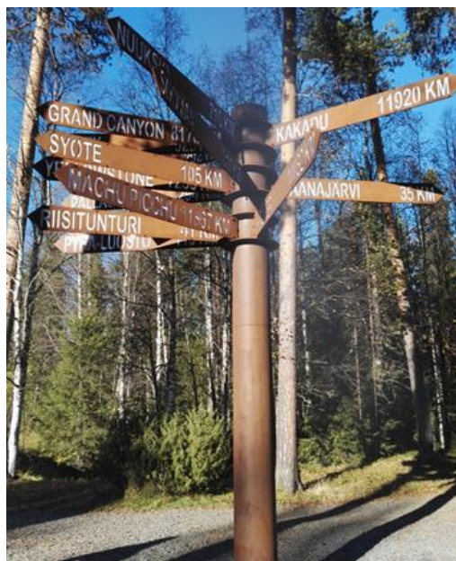
Ammatillisen kasvun polulla voi olla monta haaraa... (Kuva Karhunkierroksen maisemista.)