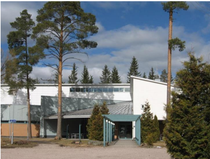
Vanhan päärakennuksen kuva on kannessa, vasemmalla kuva Liakka-talosta.

Käytettävissä on kaksi erillistä tilaa häätjuhlien viettoon varten. Useimmiten varsinainen häätjuhla pidetään yli 120-vuotiaan vanhan päärakennuksen juhlasalissa ja ruokailut järjestetään vuonna 2012 valmistuneessa Liakka-talon ravintola Katajanmarjassa. Moderni ravintola sopii myös sellaisenaan pienempien juhlien järjestämiseen. Molemmat rakennukset sijaitsevat vierekkäin opiston pihapiirissä, jossa on lisäksi tarjolla runsaasti majoitustilaa häävieraille. Vanhan päärakennuksen juhlasaliin ja ravintola Katajanmarjaan mahtuu kerralla juhlimaan n. 132 henkilöä.