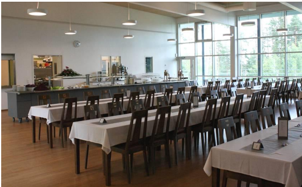
Alla kuva Liakka-talon ravintola Katajanmarjasta.